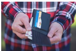
1 Varia loon- en premieheffing

Tevens bevat deze editie informatie over bijvoorbeeld de auto van de zaak, de thuiswerkvergoeding, de WKR en de transitievergoeding.