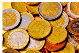
4 Wet tegemoetkomingen loondomein