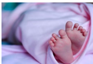
7 Varia Arbeidsrecht