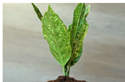
8 Verduurzaming en klimaat