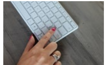
3 Ondernemingen en ondernemers