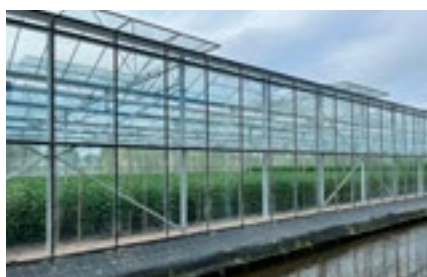
8 Verduurzaming en klimaat