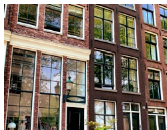
2 Onroerend goed