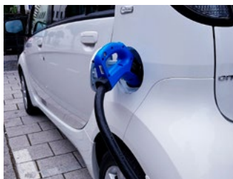
5 Vervoer en verduurzaming