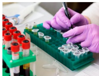
6 Vastlegging coronasteunmaatregelen